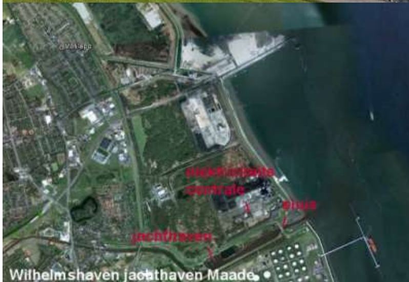
Wilhelmshaven jachthaven Maade