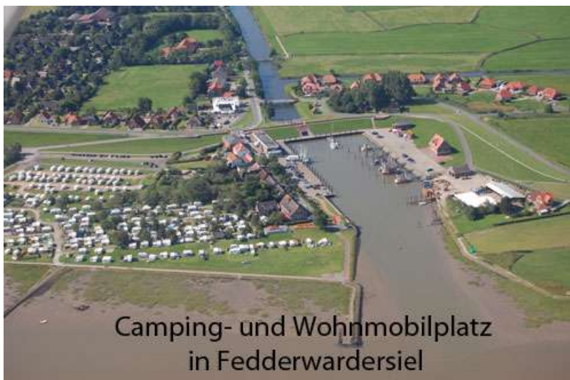
Camping- und Wohnmobilplatz in Fedderwardersiel