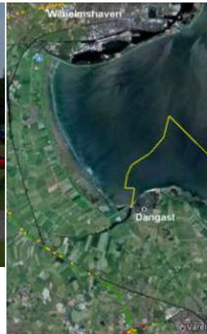
route Dangast - Varel

De jachthaven van Dangast ligt voor de sluis en is omgeven door grasvelden. Naast de haven ligt een camping, die vooral voor campers wordt gebruikt.