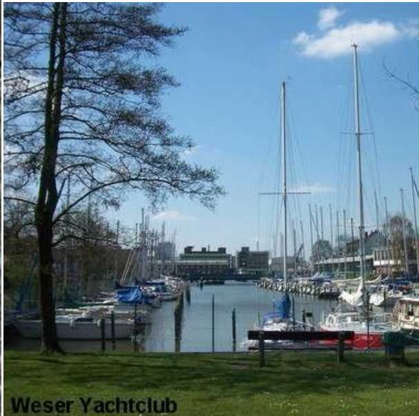
ligplaatsen voor pleziervaart Bremerhaven